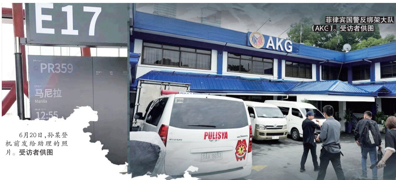
6月20日,孙某登机前发给助理的照片。