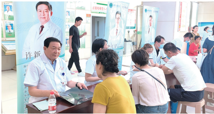
“6·28国际癫痫关爱日”癫痫救助公益活动现场